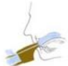
Emisión del sonido