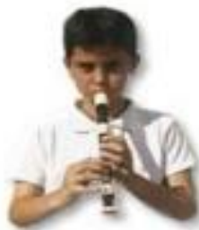
Postura del cuerpo