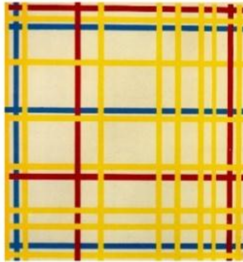
New York City (1942)