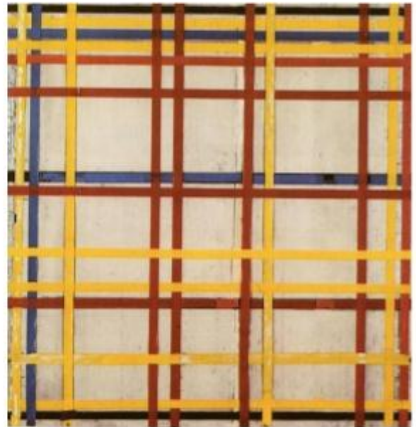
New York City II (1942-1944)