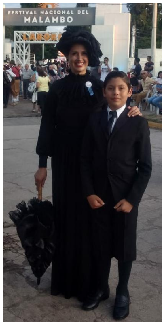
CARACTERIZACIÓN MUJER DE 1910