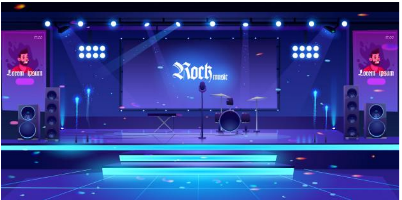
Escenario con instrumentos y equipos de música rock

Las producciones multimedia pueden verse en un escenario (por ejemplo, un recital), pueden proyectarse o transmitirse, o bien se las puede reproducir en ciertos dispositivos (celular, mp4, etc.) que además permiten su almacenamiento.